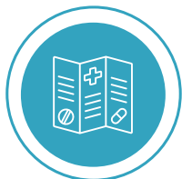
Informiranje in ozaveščanje